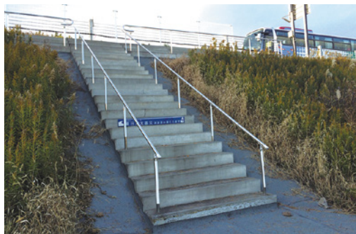
東部道路への災害時用避難階段を整備