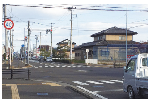
蒲町小学校前 交差点信号機に右折標示を設置