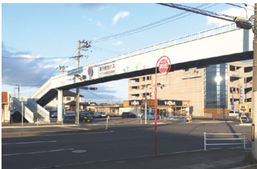
六丁の目第1・第2歩道橋の改修・フェンスの設置