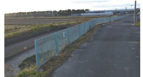
各水路への転落防止フェンスの設置