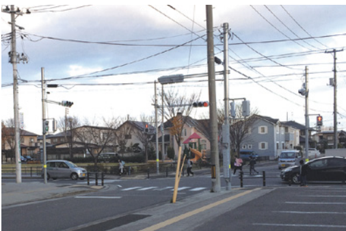
新旧荒井地区の交通量増加に対応し信号機を設置