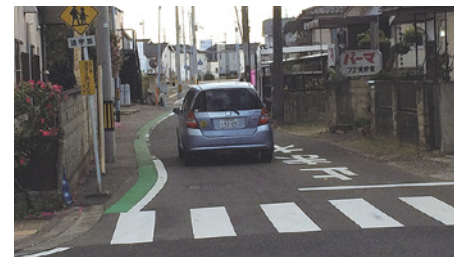
蒲町小学校 通学路の歩行帯の拡幅