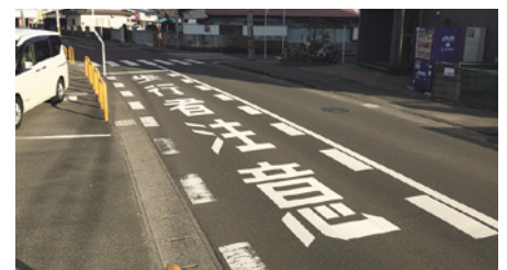
蒲町中学校 通学路交差点の路面表示